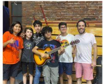
LOS REOS DEL 1452 19:45 HRS