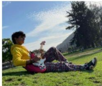
LOS BIGOTES DE GARCIA 18:00 HRS