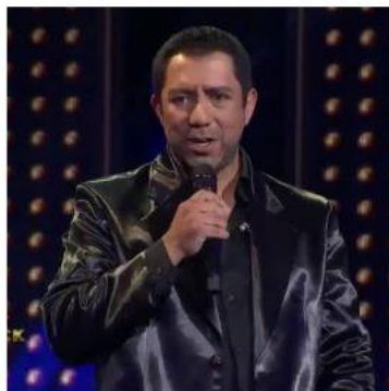
JOE COCKER PROFE LUIS MORALES 22:00 HRS