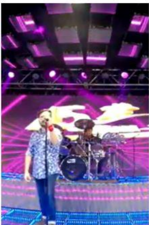
LOS ENANOS DEL CERRO 20:30 HRS